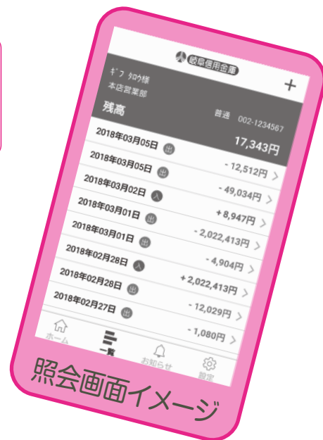
照会画面イメージ